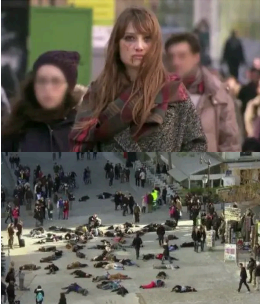
Hapening Contra La Indiferencia con motivo del Día Internacional d ela Violencia de Genero 8